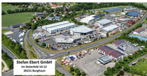
Stefan Ebert GmbH Im Steierfeld 10-12 36151 Burghaun